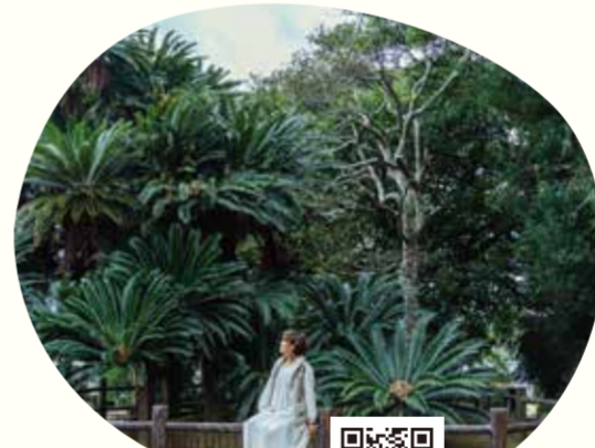
08 坂井神社の大ソテツ

坂井神社の大ソテツは、樹齢300年以上の圧巻の巨木。間近で見るとその大きさに誰もが驚きます。全体像を収めるには境内奥からの撮影がベストです。