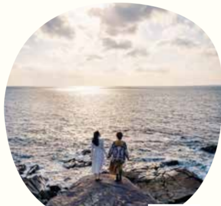
18 板敷鼻(いたじきばな)

断崖絶壁と壮大な海のパノラマが楽しめる絶景スポット。特に、岬先端からの撮影が人気で、荒々しい波しぶきと水平線が織りなすダイナミックな風景はフォトジェニックで人気。