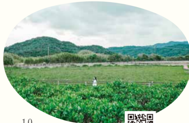
10 種子島マングローブパーク

広がるマングローブ林と静かな川の景観が魅力。展望デッキからは一望できる絶景を撮影可能。カヤックの体験もあるので、ぜひそちらも楽しんでみてください。