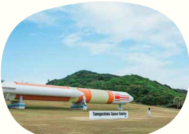
12 種子島宇宙センター

種子島宇宙センターは、宇宙やロケットに関する展示が魅力の種子島屈指の観光スポットです。星空や宇宙に関する知識を楽しく深められるほか、フォトスポットもいっぱい！