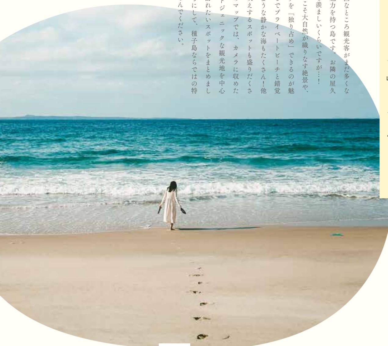
17 能野(よきの)海水浴場

白い砂浜とエメラルドグリーンの海が広がる絶景スポット。夕陽の時間帯が特におすすめで、棧橋からの撮影で海と空が織りなすドラマチックなシーンを捉えられます。